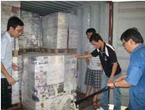
Các thành viên Vietnam 2020 chuyển sách vào container của Gemadept

Không chỉ tạo một mái nhà chung cho người Việt xa xứ và bắc cầu nối về quê nhà, tập hợp trí thức Việt tại Singapore, nhóm Vietnam 2020, cũng đang chuyển về quê hương hàng chục ngàn cuốn sách khoa học, sách giáo khoa có giá trị đối với sinh viên và những người làm công tác khoa học. World Scientific, nhà xuất bản sách khoa học nổi tiếng của Singapore, thông qua nhóm đã tặng Việt Nam hơn 30.000 đầu sách.